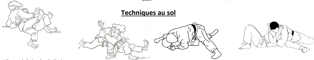
Uke a pris la jambe de Tori