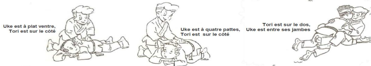
Uke est à plat ventre, Tori est sur le côté